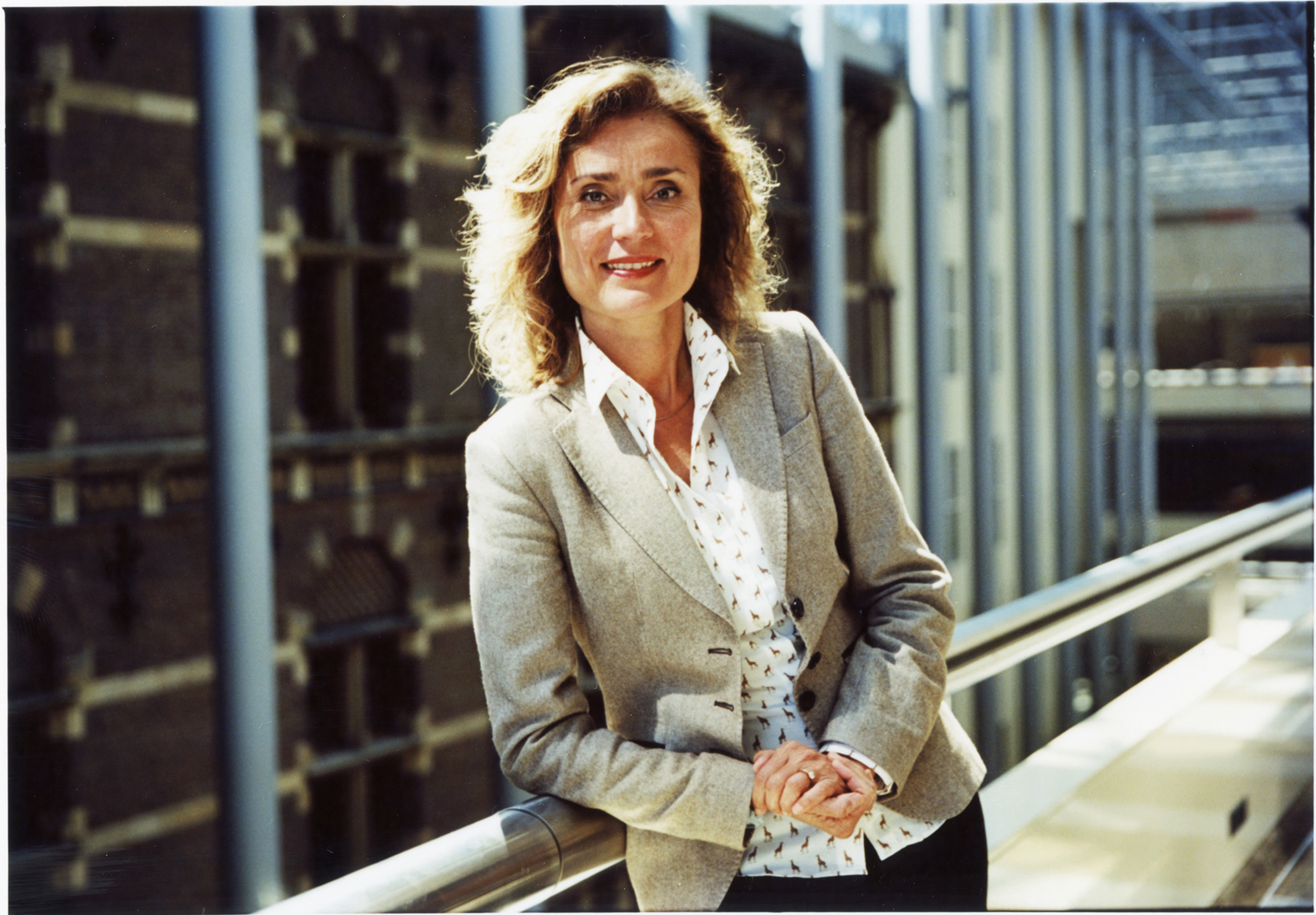
VICE: Vera Bergkamp / Kodak Portra 35mm print scans