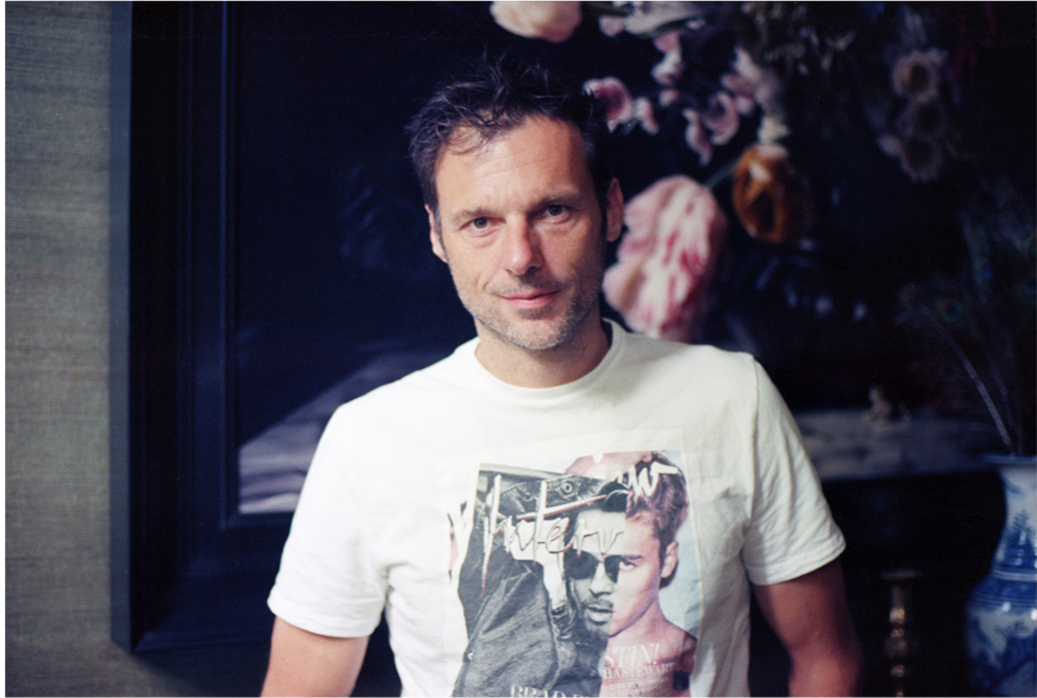
Duncan Stutterheim / Kodak Portra 35mm negative scans