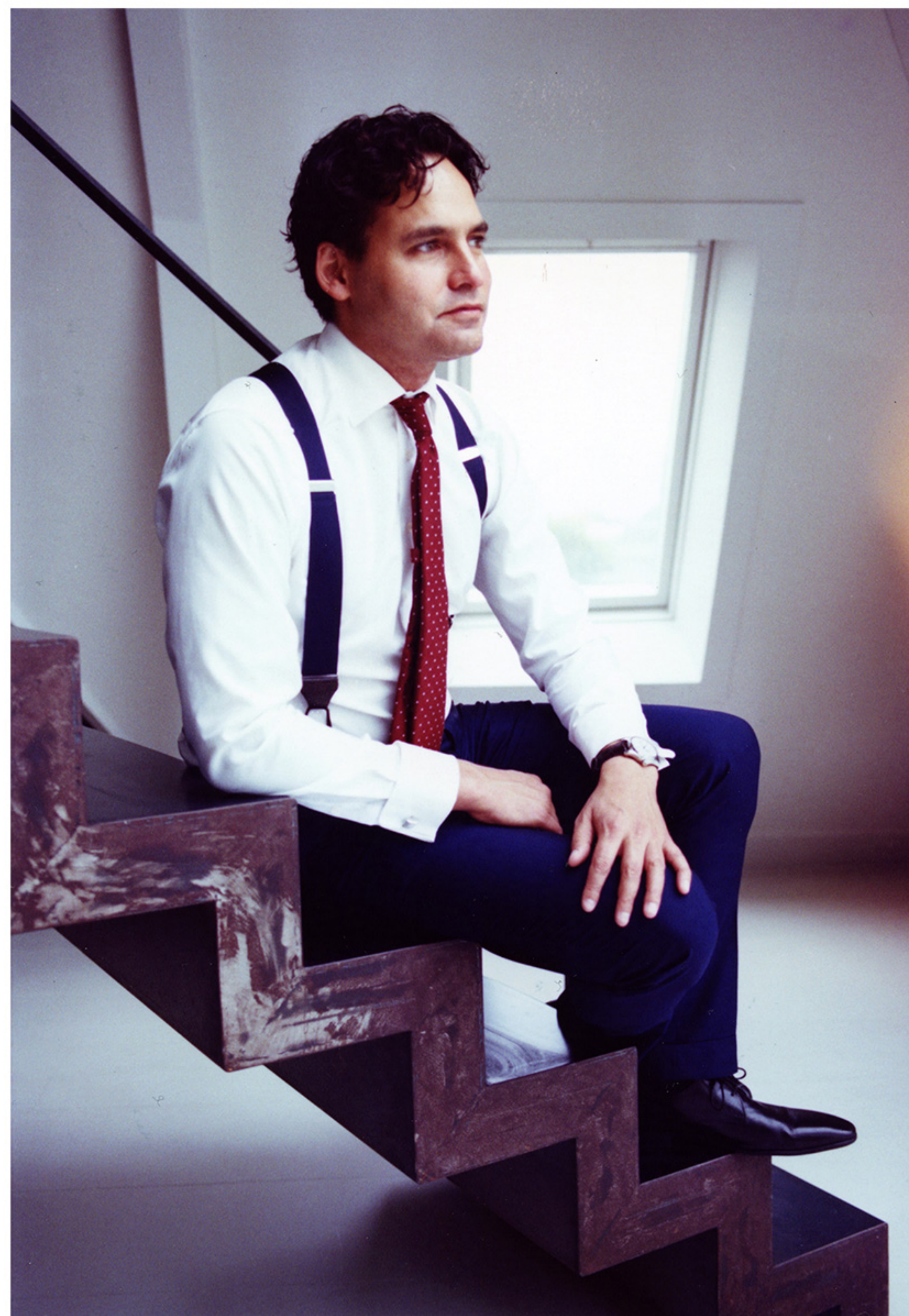
Seiko / Kodak Portra 35mm neg+print scans